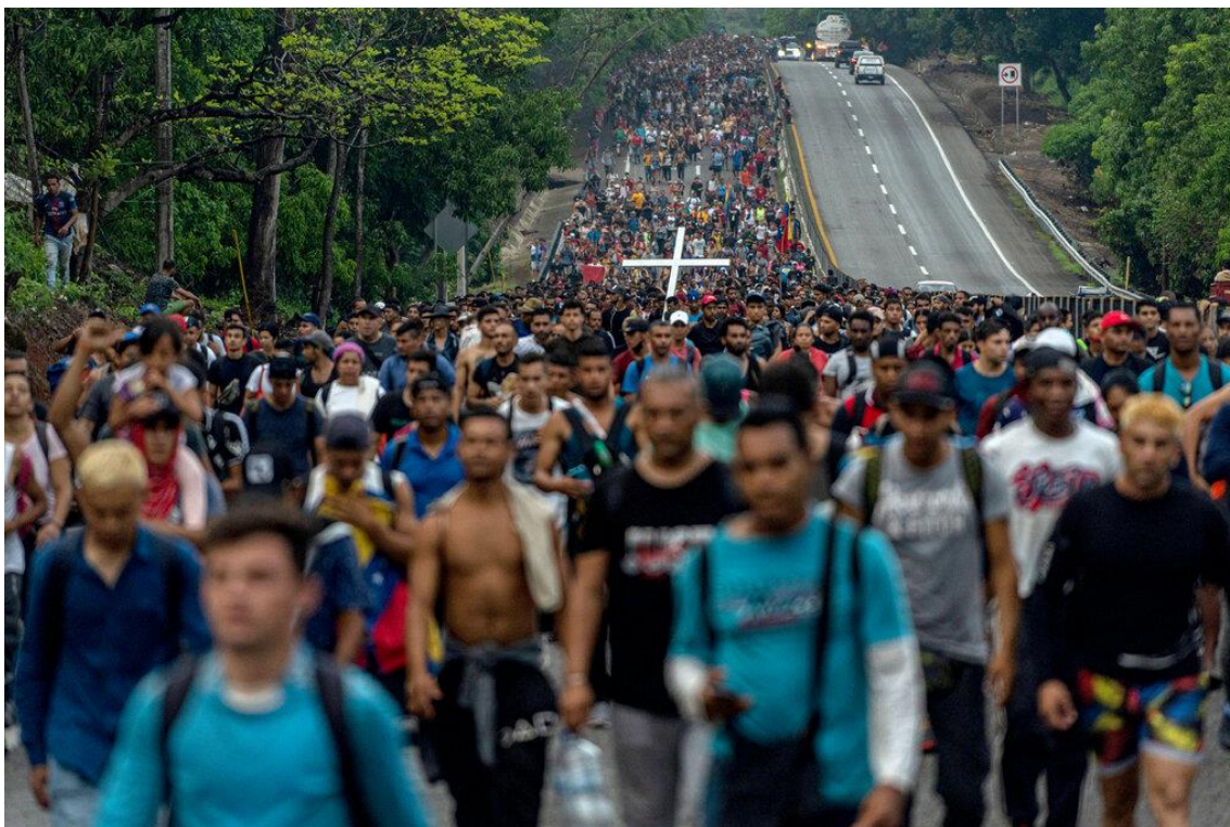
Caravanas de migrantes procedentes das Américas do Sul e Central em estrada na Cidade do México

De acordo com o documento, as ações dos signatários seriam direcionadas a: