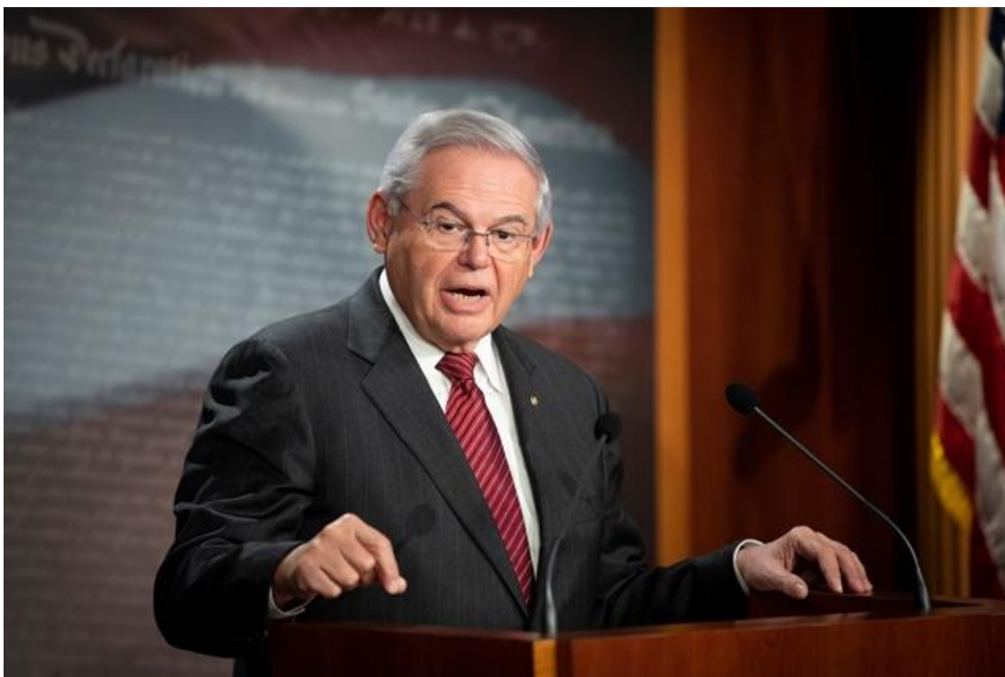
Senador Bob Menendez

Também o Senado dos Estados Unidos se mobilizou para acenar aos países da América Latina e Caribe um rejuvenescimento da relação por meio de investimentos produtivos. Os senadores Bob Menendez (D-NJ), Todd Young (R-IN), Tim Kaine (D-VA), Bill Hagerty (R-TN) e Chris Coons (D-DE) apresentaram uma resolução bipartidária , pedindo maior apoio às iniciativas de reshoring e nearshoring para realocar as cadeias de suprimentos globais para os Estados Unidos e países parceiros no Hemisfério Ocidental.