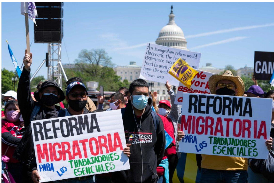
Manifestantes reivindicam caminho para cidadania em protesto no National Mall, em Washington, D.C., 1º de maio de 2021

durante o governo Trump continua, mesmo quando a Câmara dos Representantes começa a abrir para a população os bastidores dos ataques ao Capitólio em 6 de janeiro de 2021. Ao mesmo tempo, cresce a frustração com o governo Joe Biden por sua incapacidade de entregar à população suas principais promessas de campanha, como a retomada dos investimentos em infraestrutura, o apoio às energias alternativas, a reforma da imigração e ações para mitigar as disparidades sociais. Ainda nesse aspecto, chamam atenção os efeitos das sanções sobre países, cujos sistemas políticos são objeto de crítica por parte de Washington, como Cuba, Venezuela, Nicarágua e, em menor intensidade, El Salvador.